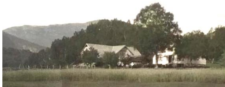
Haa sett fra sørøst – her med ny driftsbygning vest for stovehuset, sistnevnte ble i 1930-årene flyttet og reist opp igjen i Åbødalen.