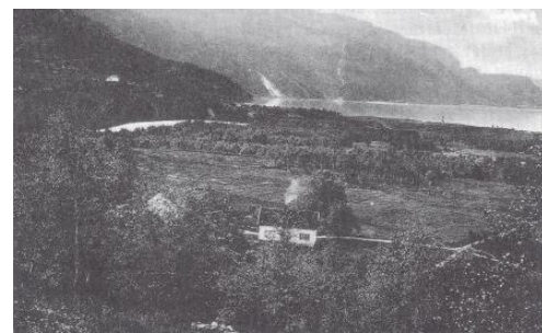
Haa Aabø – Saudafjorden i bakgrunnen