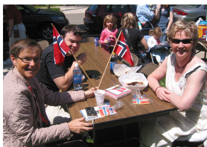
17. mai i Stoughton, Wisconsin

Spennende, Krevende, men Kjekt, er beskrivelsen. Til nå har oppgavene mye vært knyttet til organisasjoner. Omorganiserings- og effektiviseringsprosesser utfordrer både ledelse og medarbeidere. Det har vært nok å gjøre. Detaljer finner dere på etablissementets hjemmeside: www.persett.net/veiledning