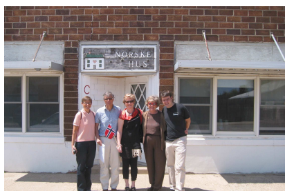
The Norske Hus, Rake Iowa

Vi har snakket om det en stund. Men ting trenger å modnes. Under Solveigs videreutdanning i veiledningsfag, startet tanken om å skape egen virksomhet. Så ved starten av 2008, var det en realitet.